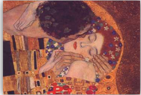
Detalle del cuadro "El Beso" de Gustav Klimt.

Reconocer que la sexualidad forma parte de toda la PERSONA y condiciona la forma de ser: en hombre o mujer.