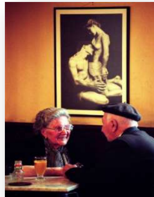
Fotografía Colección ESTAMPAS. Gabriel Tizón. Ferrol.1973.

El docente invitará a los alumnos a detenerse unos minutos y observar sin prisas la fotografía y a compartir con el resto de compañeros todo aquello que les haya llamado la atención. Es importante conducir a los jóvenes a que se cuestionen si las dos parejas se comunican de la misma manera y si expresan su amor de la misma forma.