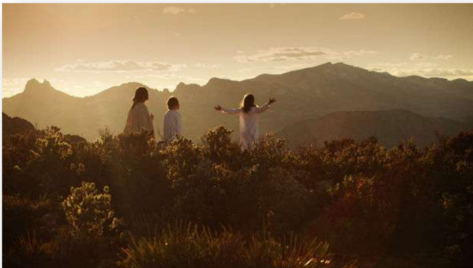
Imagen de la película

Entonces los ángeles le dejaron y nunca más volvieron a preguntarle a Dios sobre el porqué de la libertad de los hombres, pues entendieron que lo que Dios deseaba no era otra criatura que le obedeciera, sino que deseaba mucho más: Deseaba una criatura que le amara.