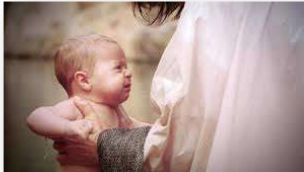
Imagen de la película

Así creó su mayor obra: el ser humano, una criatura capaz de la mayor belleza al haber sido dotado de la capacidad de amar. Y Dios sabía que el amor, además de suponer la mayor belleza, también significaba la máxima felicidad en una criatura, pues no había otra mayor.