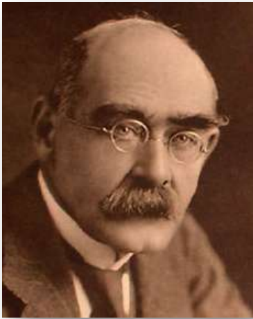
Rudyard Kipling, 1865. Escritor y poeta. Autor de "El libro de la selva".

3 Terminamos esta sesión con la lectura de una poesía que expresa la elección una criatura dotada de humanidad y libertad.