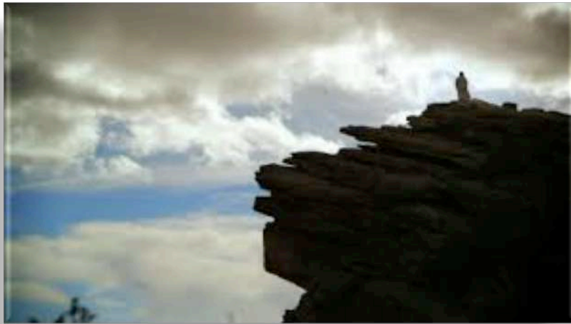
Imagen de la película

Con paciencia y cariño y confiando en la bondad e inteligencia innata de su criatura, Dios decidió confiar, esperar y ayudarlo a retomar el camino inicialmente diseñado. Esperaba y esperaba, confiaba y confiaba. Pero el hombre cada vez se alejaba más de los actos buenos necesarios para poder compartir el ser y la felicidad divinas.