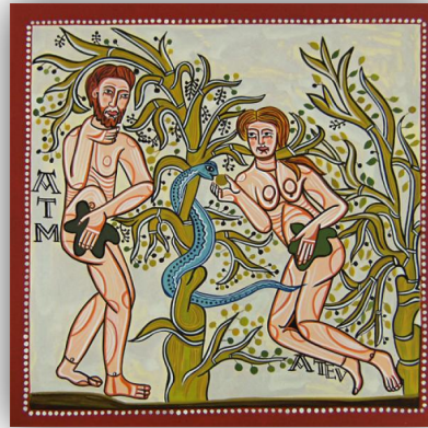
Frammento di pittura murale, eremo della Vera Cruz de Maderuelo (Segovia)

“Passano da un delitto all'altro, e non conoscono il Signore” Ger 9,2