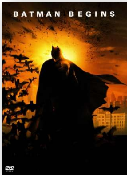
Batman Begins (USA, 2005), basato sul supereroe Batman, diretto da Christopher Nolan.

Esiste un modo per prepararti o proteggerti di fronte a queste situazioni?